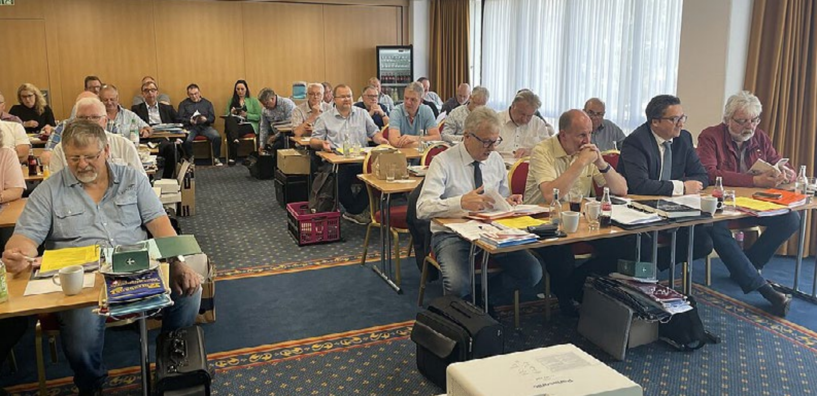
Die bereits am Sonnabend durchgeführte Gesamtvorstandssitzung bot reichlich Raum für Diskussionen und Planungen für die weiteren Aufgaben und Ziele des BDRG

zu unserem bekannten "Hühnerhotte" bot für jeden etwas. Natürlich kommen wir in erster Linie zusammen, um die zukünftigen Entwicklungen und Weichen für die Rassegeflügelzucht in Deutschland zu stellen. Dafür ist vor allem die Gesamtvorstandssitzung mit ihren Anträgen und Diskussionen der richtige Ort. Eine kurze Zusammenfassung der Anträge findet sich im weiteren Verlauf ebenso wie etliche Impressionen aus den Tagungen und auch vom Festabend. Hervorzuheben ist sicherlich die komplette Neufassung der AAB, die