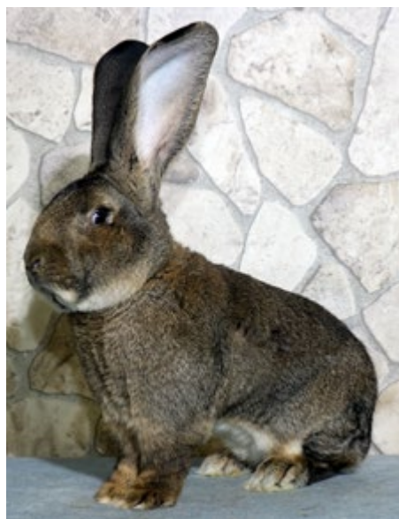
Beliebteste Kaninchenrasse des Jahres 2024: Deutsche Riesen wildfarben

■ Wolfgang Elias, ZDRK-Referent für Öffentlichkeitsarbeit