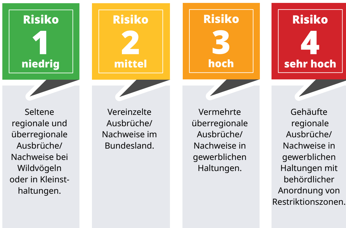
Tab. 1: Risikobewertung für den Ausstellungsbetrieb nach Regionalität und Haltungsart