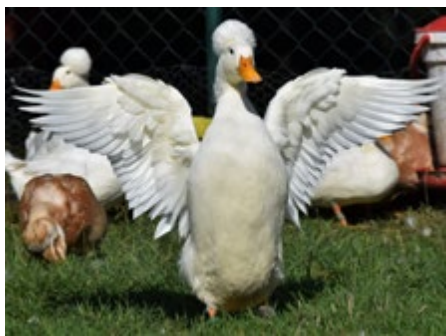
Die Landente mit Haube wird aktuell wieder in einer Doktorarbeit untersucht.

welche im überwiegenden Maße in Verhaltensexperimenten und Beobachtungen umgesetzt wird. Invasive Experimente an den Tieren, die über ein Blutentnahme hinausgehen, werden aus ethischen Gründen abgelehnt.