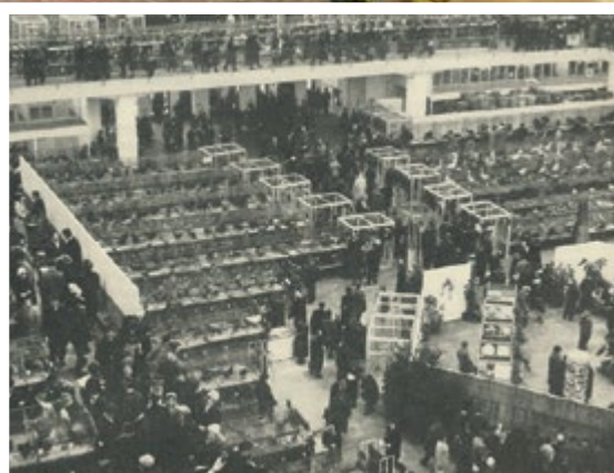
Blick in eine der Ausstellungshallen der LIPSIA-Schau in Leipzig in den 1960er Jahren.