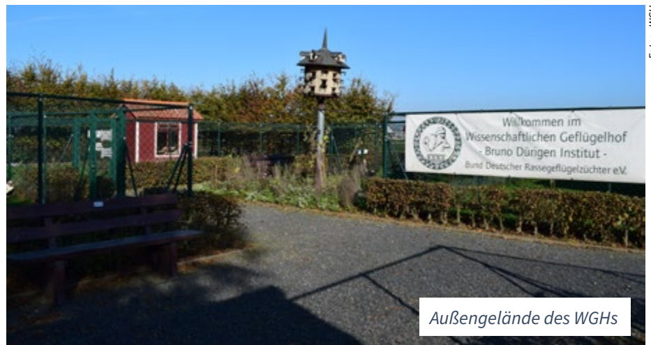
Außengelände des WGHs

Aus der Sorge heraus, dass ein Zuchtverbot bei Landenten erst der Anfang sei und vor dem weiteren Hintergrund, dem schönen Rassegeflügel eine geeignete Plattform für die Außendarstellung zu geben, machte der BDRG einen zukunftsorientierten und auch sehr mutigen Schritt. Er schaffte eine eigene Forschungseinrichtung, die sich um