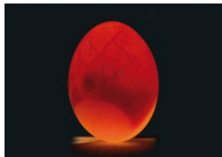
Die Nachzucht ist ein wichtiger Beitrag zum Erhalt der genetischen Vielfalt