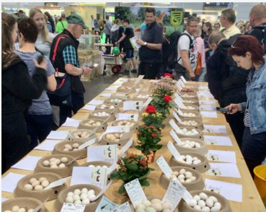
Bruteierschau mit Bewertung

durch unseren Landwirtschaftsminister geehrt werden. ( ein extra Bericht angefügt) Im Anschluss an die Eröffnung fand die Kinder agra statt, moderiert von Dr. Golze und Frau Oepfert konnten ca. 230 Kinder in den verschiedenen Altersgruppen begrüßt werden. Unter der Überschrift Vater, Mutter, Kind standen auch die Tier so zur Verfügung und konnten dann im Bereich der Agst in der Halle 5 auch von den Kindern angeschaut werden was sehr Interessant war und viel Fragen durch die Betreuer der einzelnen Bereiche beantwortet werden mussten. An allen 4 Tagen gab es dann Nachmittags jeweils noch ein Grosses Schaubild wo natürlich die Ränge bis auf den letzten Platz gefüllt waren. Von Freitag bis Sonntag nutzten die Verbände der Schaf und Ziegen Züchter, die Züchter der Lamas und Alpakas, die Rassekaninchen Züchter und natürlich auch die Sächsischen Rassegeflügelzüchter den kleinen Tierschauring für die Präsentation ihrer einzelnen Rassen und Farbenschläge. Von unserer Seite wurden hier besonders das Dresdner Huhn die Italiener in verschiedenen Farbenschlägen, die Barnevelder und natürlich die modern englischen Zwergkämpfer welche sich sehr zutraulich