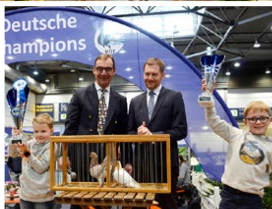
Eröffnung LIPSIA-Schau 2023 mit Ministerpräsident Michael Kretschmer.