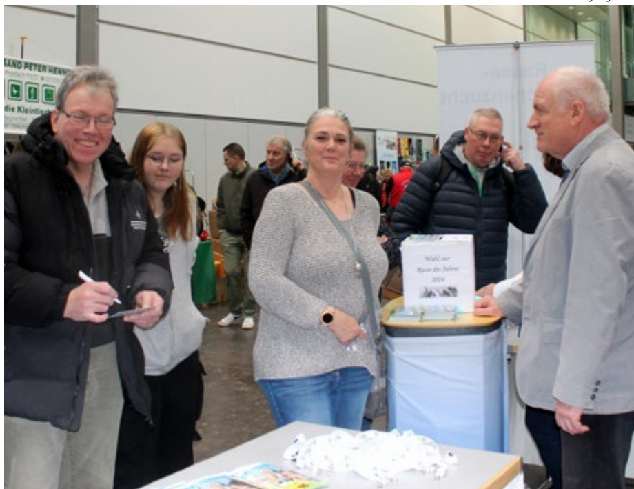
Stimmabgabe am Informationsstand des ZDRK während der 36. BKS in Leipzig

Vergangenheit wurde hier oftmals ein Züchter oder eine Züchterin, der/die diese Siegerrasse züchtet, porträtiert und in der lokalen Presse vorgestellt. Dies führt sicherlich zu einer sehr guten Außendarstellung der Rassekaninchenzucht im Allgemeinen und ganz konkret des Vereins.