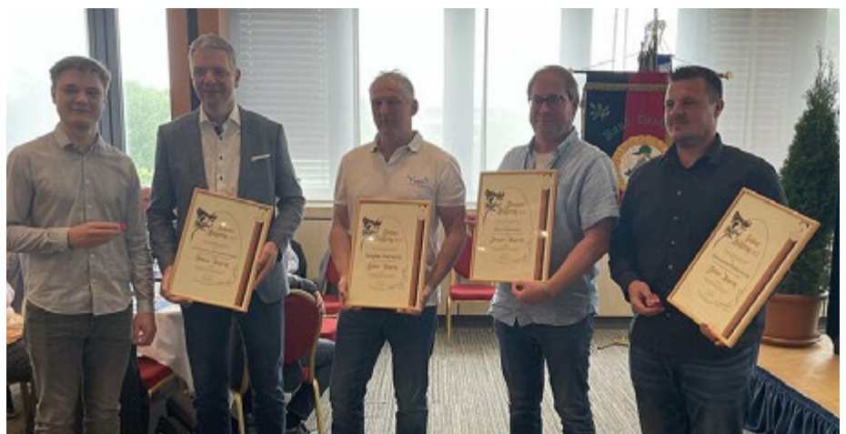
Anlässlich der obligatorischen Auszeichnung für die letztjährigen Siegringerringer gab es freudige Gesichter – Herzlichen Glückwunsch!