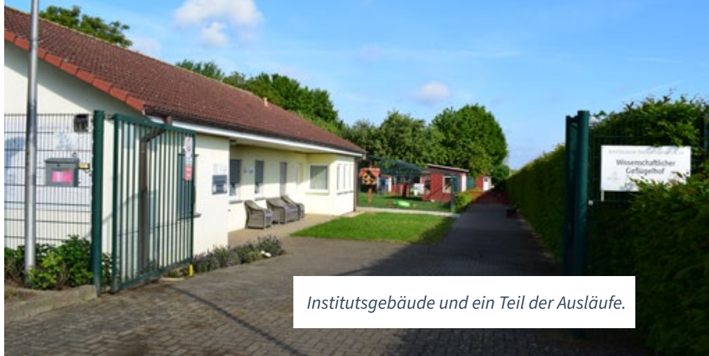
Institutsgebäude und ein Teil der Ausläufe.

Im Rahmen der Öffentlichkeitsarbeit widmet sich der WGH dem Thema Hausgeflügel. Führungen durch den WGH werden nicht nur für Züchter, sondern für alle interessierten Besuchergruppen aus dem In- und Ausland, Schulen und Fachpublikum durchgeführt. Auf diese