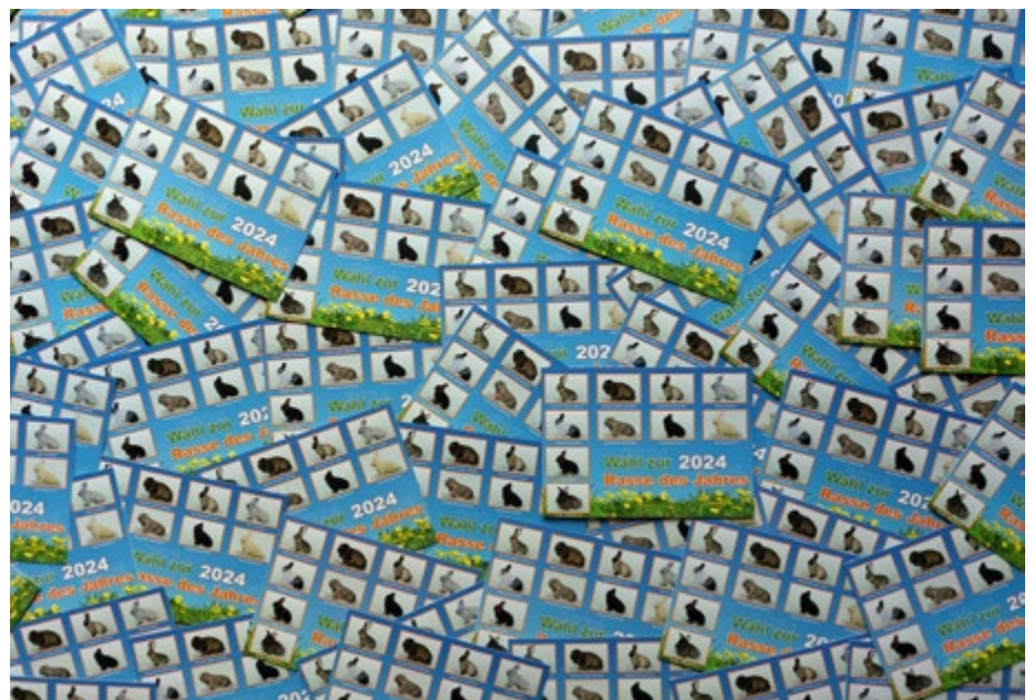
Stimmkarten Wahl Rasse des Jahres (Vorderseite)

Es wurden insgesamt 1.515 gültige Stimmen abgegeben (547 per Internet, 85 per Post und 883 bei der 36. BKS). Elf Stimmen waren ungültig (einmal bei der Abstimmung per Post, weil auf