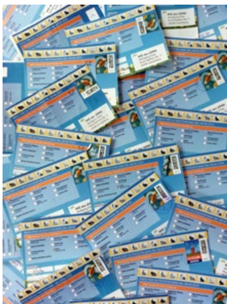
Stimmkarten, die per Post eingeschickt wurden

Auch diesmal wurde wieder neben den Veröffentlichungen in der Fachpresse und im Internet als Werbemaßnahme zusätzlich eine Pressemitteilung mit begleitenden Informationen an zahlreiche Medien herausgegeben. Noch rechtzeitig vor dem Osterfest Ende März haben somit auch die Vereine und Verbände wieder die Möglichkeit, entsprechende Maßnahmen der Öffentlichkeitsarbeit durchzuführen und mit der Siegerrasse als „Aufhänger“ für die Rassekaninchenzucht zu werben. In der